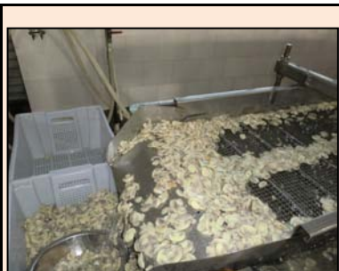
マッシュルームの機械選別

マッシュルームの産地では、50年振りの寒波到来の為、12月下旬より平均気温が3℃～5℃となっており、その生育は大幅に遅れています。本来であれば、春節(2月上～中旬:今年は2月3日)前までには、日本向け規格の原料が多く収穫される場所ではありますが、今年は、この低温の影響によって各農家では、歩留まりを良くする為にマッシュルームの収穫を意図的に遅らせている傾向が見受けられ、結果、日本向けの原料は極端に減少しております。